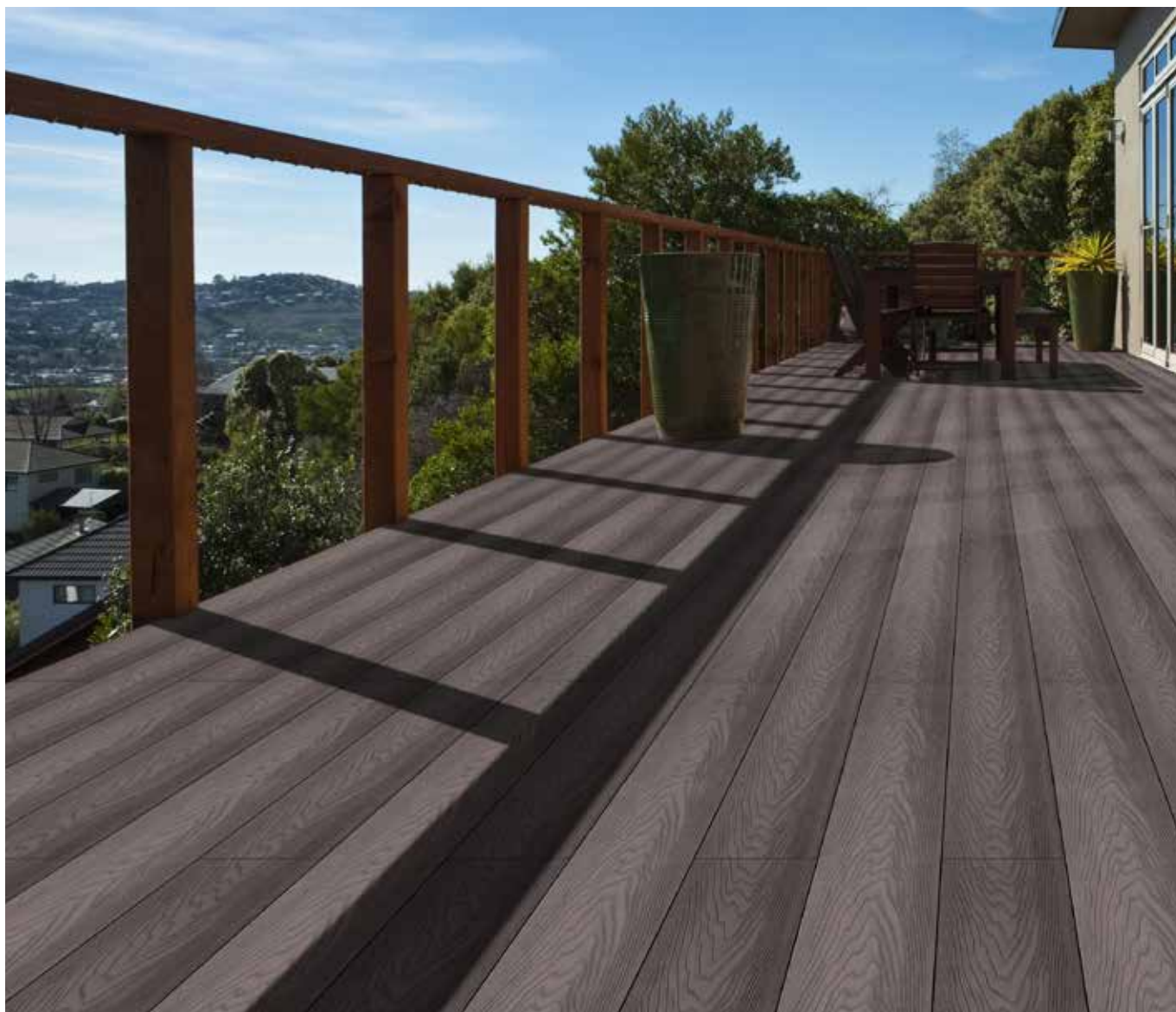
GARDIN NATUR - Orech Antik