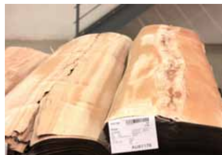
Čerstvo nakrájané dyhové listy