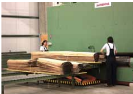
Sušenie listov dyhy