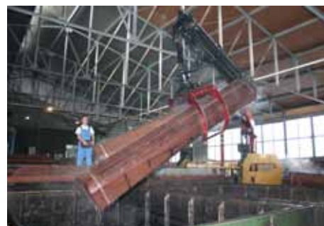
Parenie dyhárenských výrezov